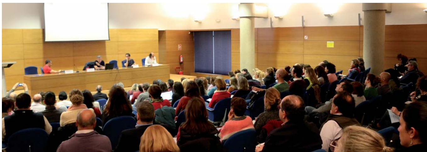
Buena parte de las ponencias presentadas en la sede de Mercamadrid estuvieron dedicadas al control oficial en estas instalaciones, así como a las estrategias y métodos con los que se combaten los fraudes alimentarios.

carnicerías, cámaras frigoríficas, etc. No trabajan mojando los productos sino que trabajan con la saturación relativa, para que los productos no pierdan su humedad.