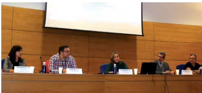
Participantes en la mesa sobre fraude alimentario que se celebró en Mercamadrid.

Hay un centro de conocimiento para el fraude alimentario y la calidad que busca producir, recopilar